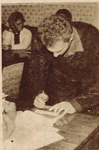
Iekšlietu ministrijas mācību centru Garkalnē.

Bet pirmā oficiālā iesaukšana valsts dienestā notika tieši pirms Lāčplēša dienas, kas arī ir ļoti simboliski.